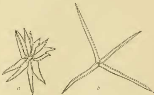
Fig. 5. a) Trichom von Hedera Colchica Koch, b) von Hedera Helix L. Vergr. ca. 150.

In den Florenwerken, so auch Boissier, Fl. orient. II, p. 1090—1091, findet man die Blätter der